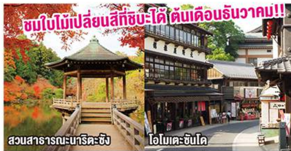
สวนสาธารณะนาริตะซัง